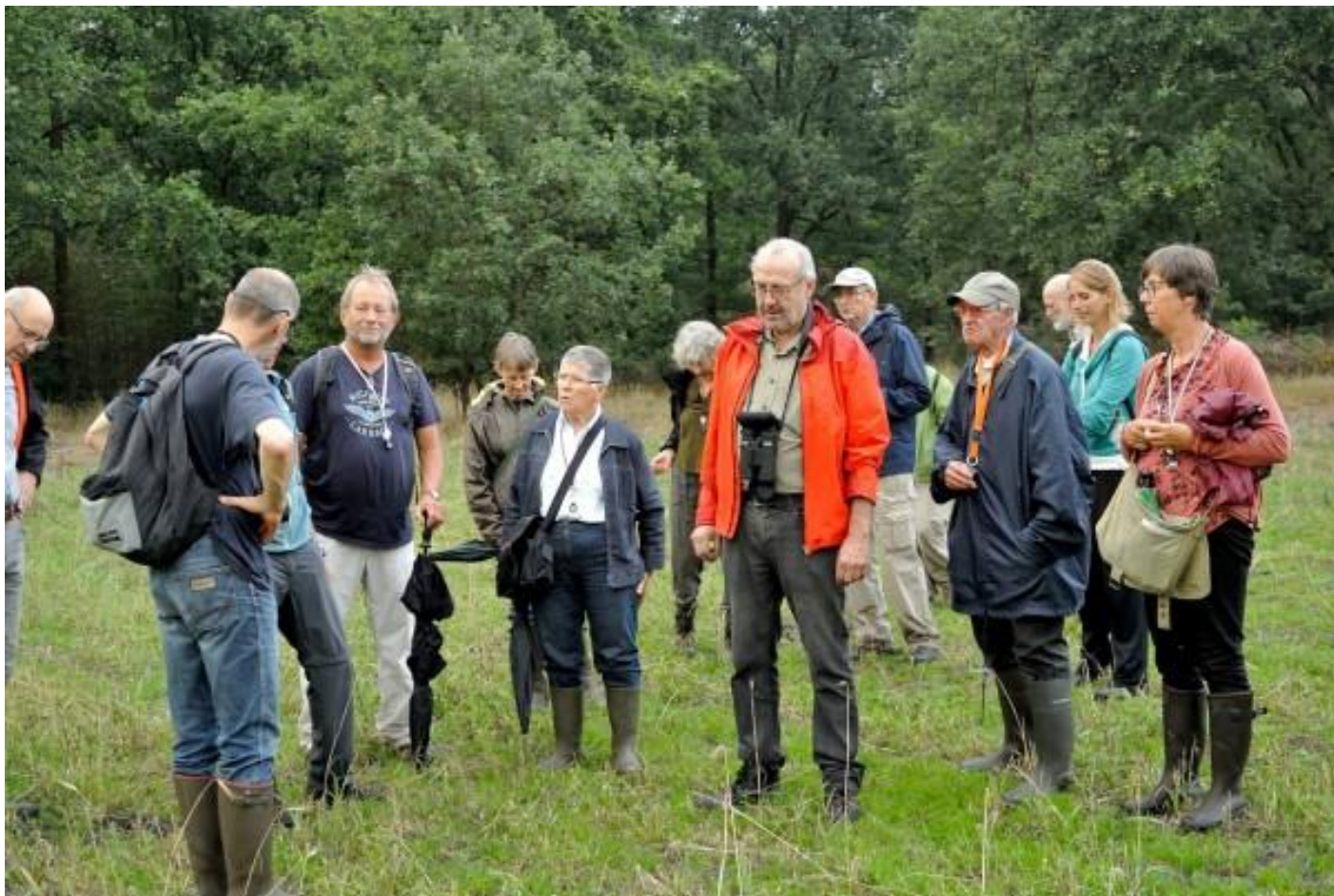
ook altijd aandachtig luisteren naar de gids