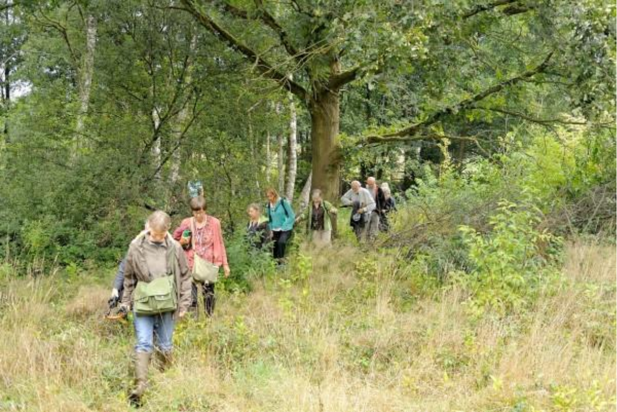
Een slobkous moet soms wat avontuurlijk aangelegd zijn.