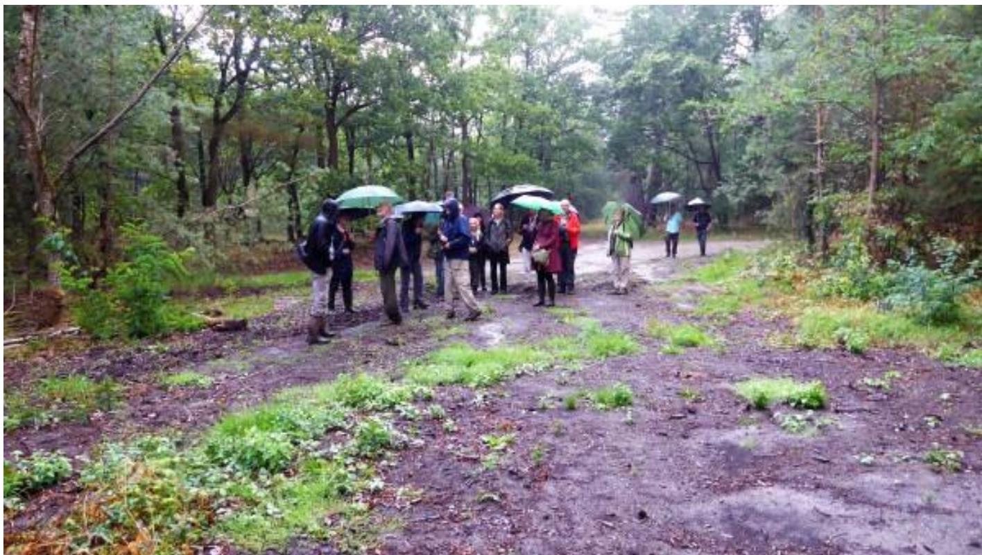
en af en toe tegen een dikke druppel regen kunnen